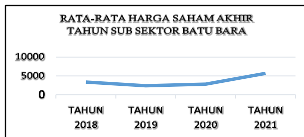
Gambar 1 Rata-Rata Harga Saham Akhir Tahun Sub Sektor Batu Bara

Penelitian ini dilakukan pada perusahaan sub sektor batu bara yang terdaftar di Bursa Efek Indonesia periode 2018-2021. Indonesia berada pada posisi ketiga penghasil batubara terbesar di dunia, produksi batubara di Indonesia tidak hanya untuk kepentingan domestik tapi juga untuk ekspor. Berikut gambar data rata-rata harga saham sub sektor batubara periode 2018-2021.